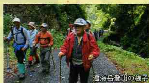
温海岳登山の様子

9:00 温海温泉林業センター出発…一の滝…二の滝…三の滝…NTT管理道路分岐点…温海岳山頂(昼食)…大赤松跡…熊野神社旧本殿(長床)…14:50 温海林業センター到着(温泉入浴後解散)