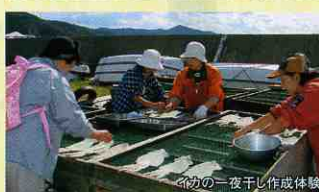
イカの一夜干し作成体験